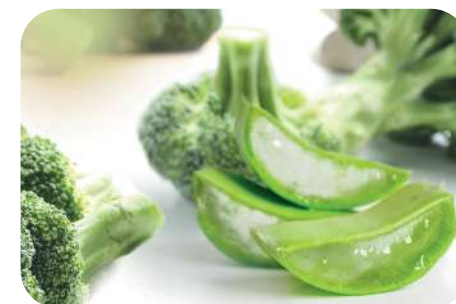
Stress Block Complex-2